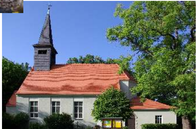
Kirche Hangelsberg