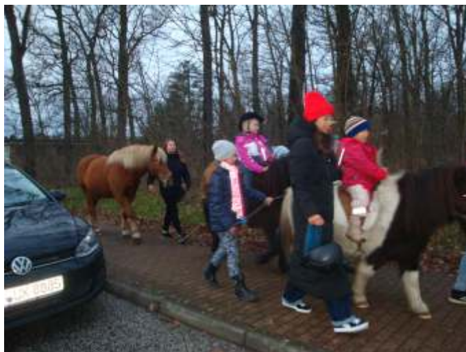
Ausritt mit den Ponys vom Ponyhof Li-Sa