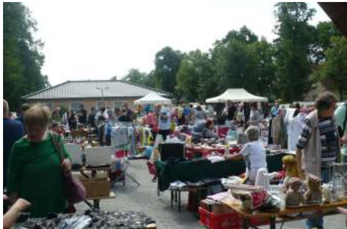
Flohmarkt am L38-Markt

Am Oma- und Opatag gibt es selbstgebackenen Kuchen oder Waffeln und es werden Spiele gespielt und erklärt, die die Mitglieder der IG in ihrer Kindheit selbst gespielt haben.