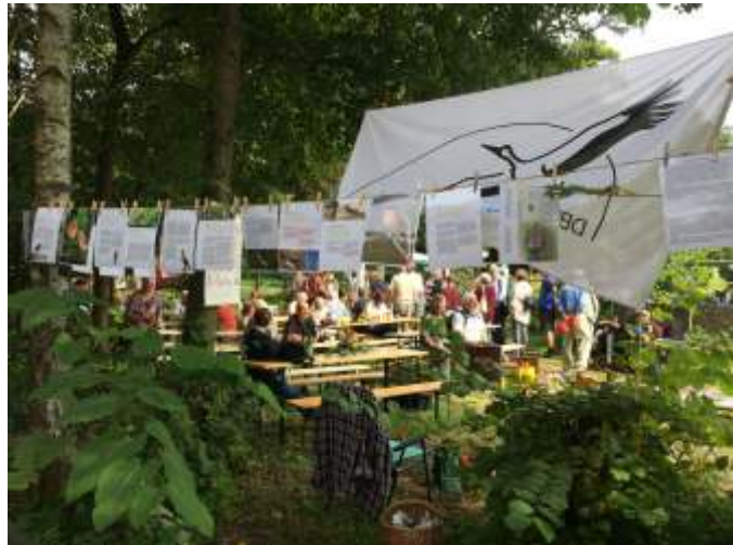
Sommerfest am Bahnhof

Im Zusammenhang mit Tesla und dem geplanten Greenworkpark erwarten die Mitglieder des Vereins ein gesteigertes Interesse am Bahnhofsensemble.