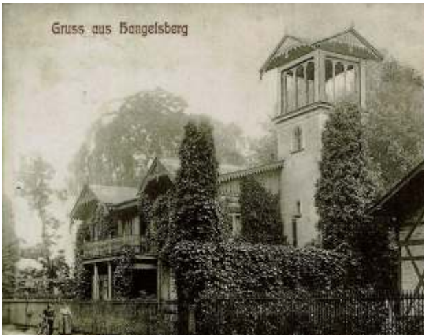
Historisches Foto der Roten Villa

Kontakte mit der Gesellschaft für Kieler Stadtgeschichte erbrachten keine Bestätigung dessen und der Chronist denkt, dass die Nazis genügend Zeit hatten, die Wahrheiten der Vergangenheit zu löschen.