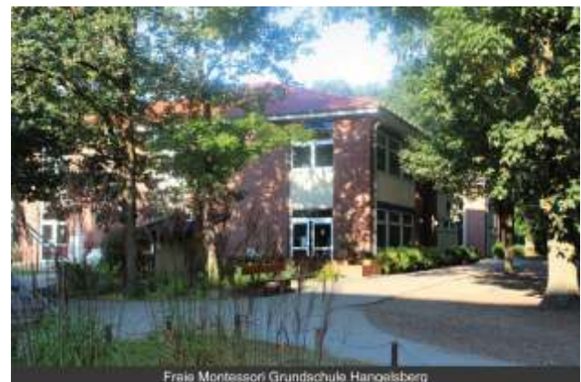
Freie Montessori Grundschule Hangelsberg