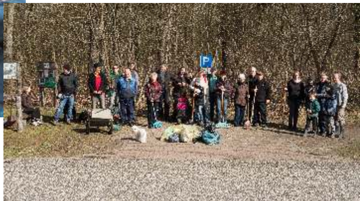
Frühjahrsputz im Wald durch Anwohner und Mitstreiter der IG Lebenswertes Hangelsberg