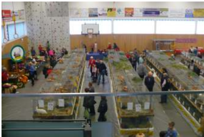
Kaninchenschau in der Müggelspreehalle

Aus der Zuarbeit des Vereins für den Ortschronisten wird deutlich, dass die Züchter, jeder Einzelne und alle gemeinsam vieles unternehmen, um bundesweit an Leistungsschauen teilzunehmen. Ihre Erfolge sprechen für sich und verleihen Hangelsberg züchterischen Glanz.