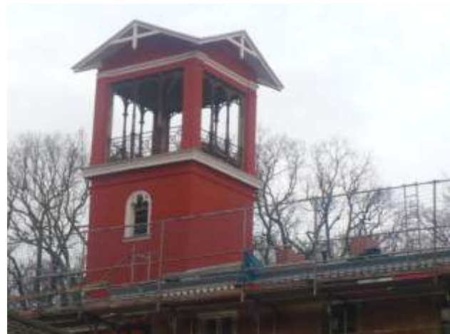
Rote Villa in Arbeit