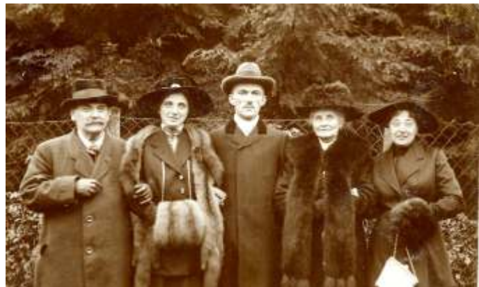
Familienfoto der Dziadeks