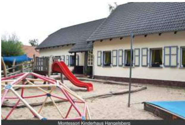
Montessori Kinderhaus Hangelsberg

Die Schulen teilten sich anfänglich das Gebäude – bis 2005 der Neubau für die Grundschule fertiggestellt wurde. Dieser bot zudem ausreichend Platz, einem lang gehegten Wunsch der Eltern nachzukommen: die Einrichtung eines Kindergartens, der ebenfalls nach dem Konzept Maria Montessoris arbeitete. Im Oktober 2005 öffnete das Montessori Kinderhaus Hangelsberg in den Räumlichkeiten der Grundschule.