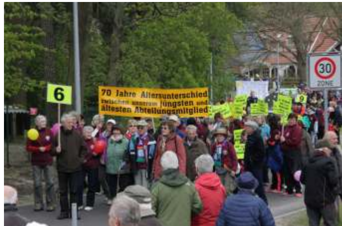
Umzug zum 70-jährigen Bestehen des Sportvereins