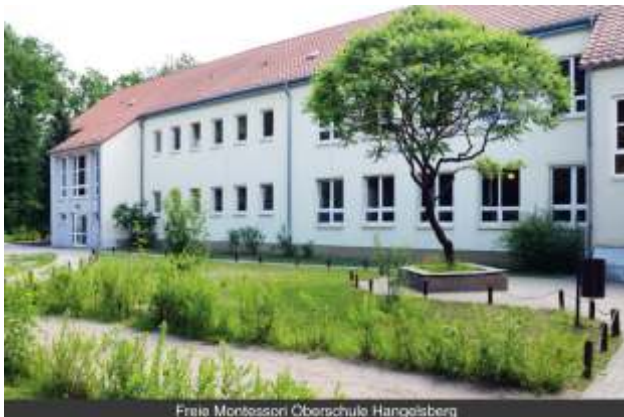
Freie Montessori Oberschule Hangelsberg

In den vergangenen 20 Jahren hat sich Hangelsberg wieder hin zu einem sicheren Bildungsstandort entwickelt. Das schenkt Vertrauen und gibt Sicherheit für die Zukunft unserer Kinder und Jugendlichen!