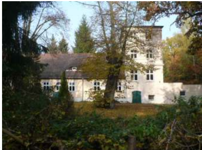
Gutshof Wulkow um 1750 durch Zisterzienser erbaut