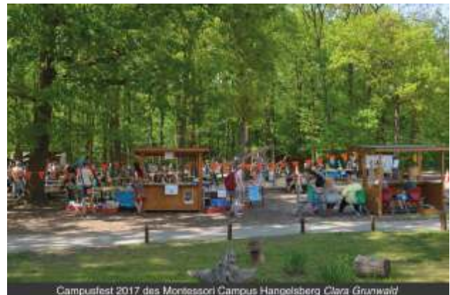
Campusfest 2017 des Montessori Campus Hangelsberg Clara Grunwald