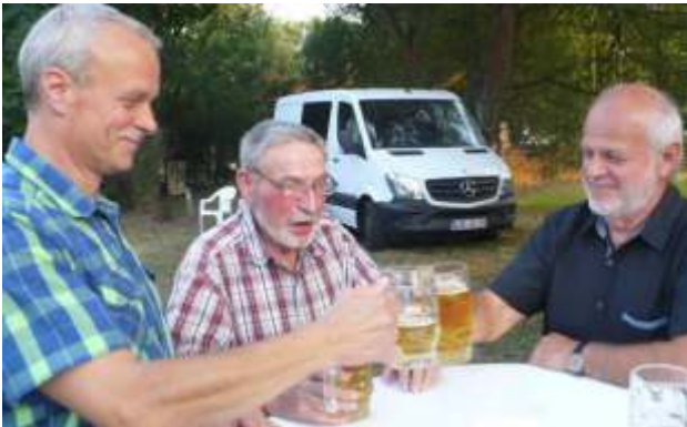
Stammtisch der Ortsvorsteher beim Sommerfest 2018

Alle Amtsgeschäfte werden durch die zentrale Verwaltung in Grünheide ausgeführt. Die bisherige Bezeichnung „Amtsdirektor“ als der Chef der Verwaltung, wurde durch den Hauptverwaltungsbeamten (Bürgermeister) abgelöst.