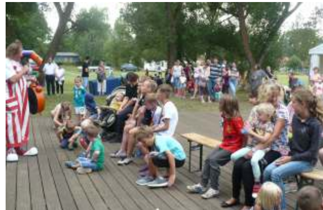
Clown beim Sommerfest 2018