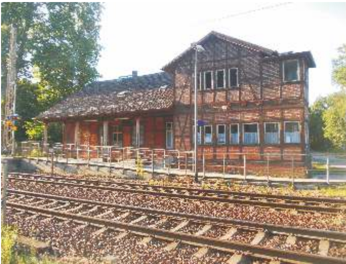
Bahnhofsgebäude im Jahr 2015

Der Hangelsberger Bahnhof selbst war zu DDR-Zeiten nach der Einrichtung des NVA-Depots und dessen Bahnanschluss stark gefordert. Das belegen acht Bahnangestellte, allein drei davon am Schalter und vier weitere im Bahnanschlussbetrieb der NVA. Nach der Abwicklung des Depots 1990 sank das Fahrgastaufkommen vor Ort auf ein für die Deutsche Bahn nicht vertretbares Maß. Das Personal wurde versetzt oder entlassen, der Bahnhof zu einem Haltepunkt degradiert und letztendlich im Jahre 2015 an den Verein „Historischer Bahnhof Hangelsberg“ verkauft.